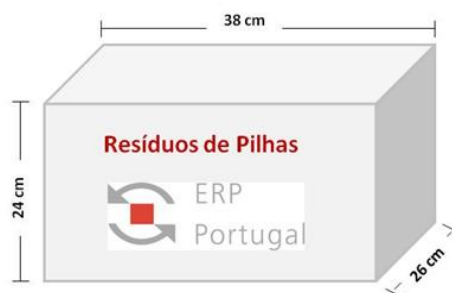
Figura 1 - Caixa de cartão para depósito e recolha de RPAP